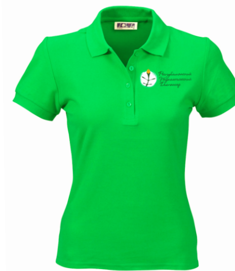
мужская рубашка и футболка